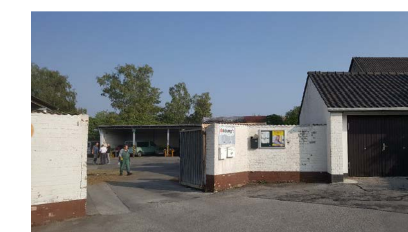
DÜSSELWEG - EINGANG KITAGELÄNDE