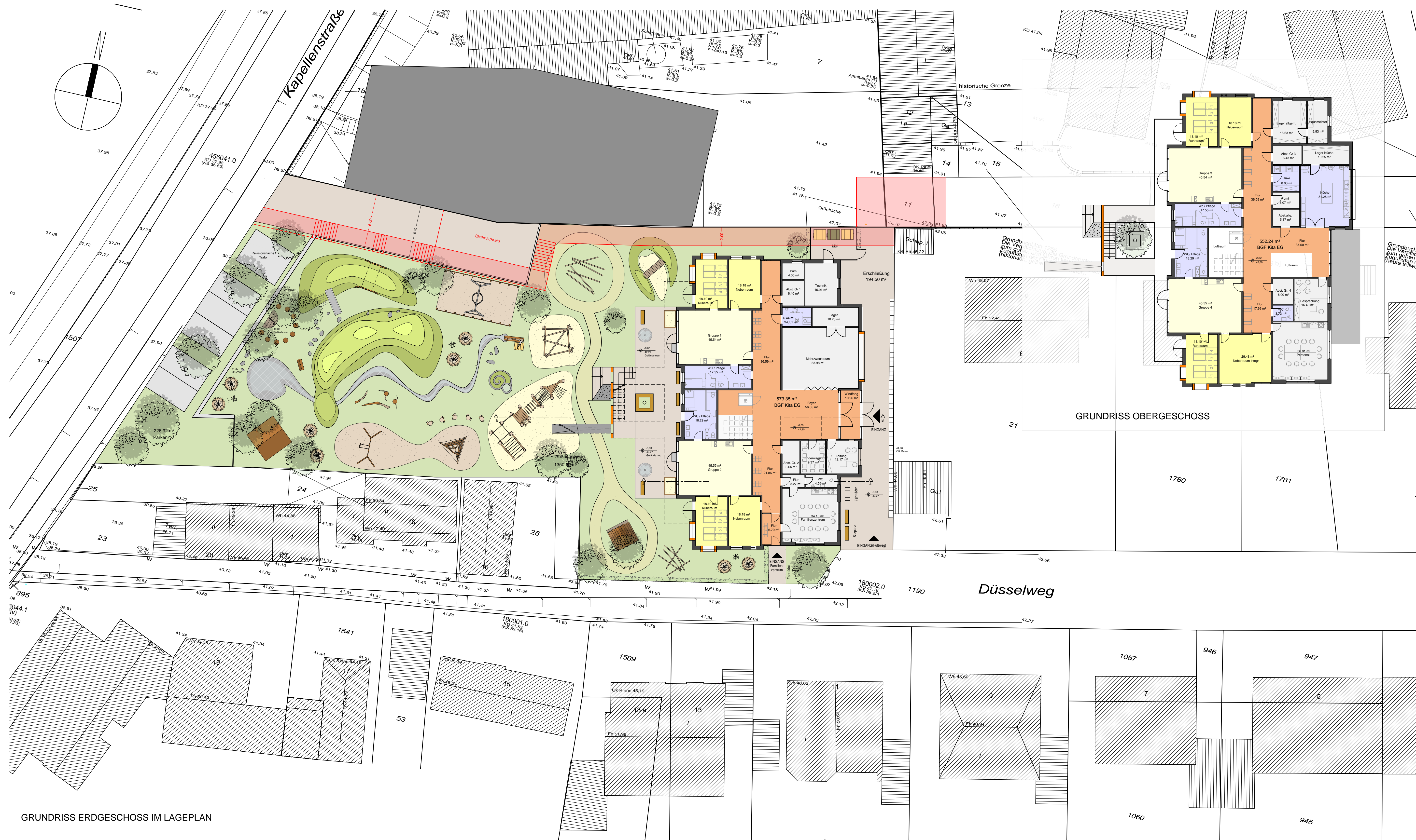
GRUNDRISS ERDGESCHOSS IM LAGEPLAN