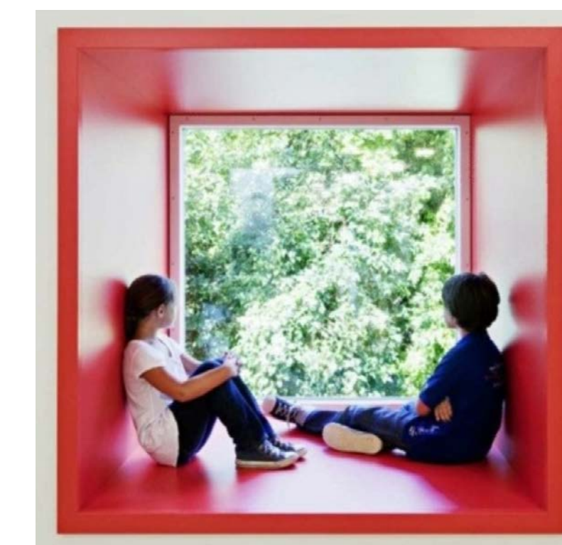
BEISPIEL KASTENFENSTER - INNEN