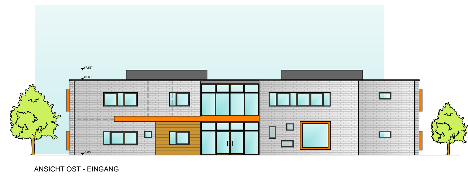
ANSICHT OST - EINGANG