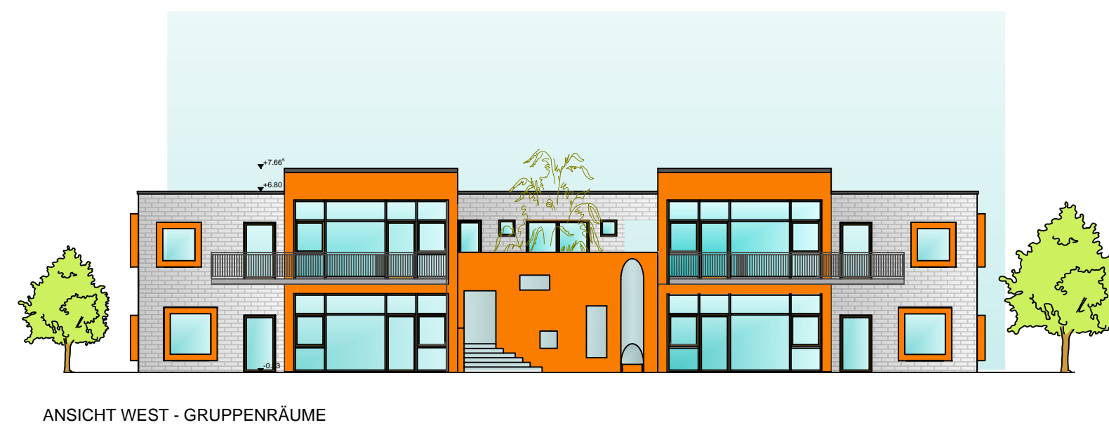
ANSICHT WEST - GRUPPENRÄUME