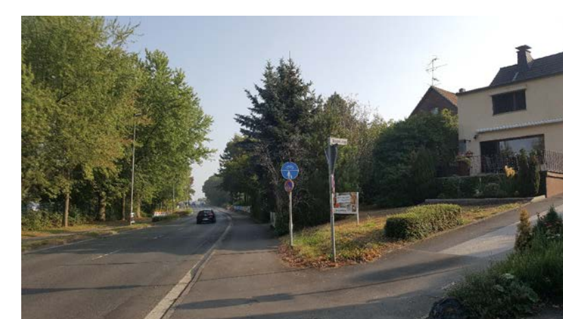
KAPELLENSTRASSE / DÜSSELWEG