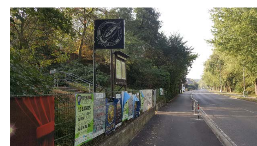
KAPELLENSTRASSE - AUFGANG SOJUS