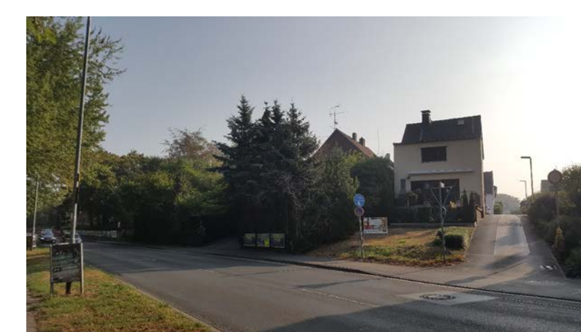
KAPELLENSTRASSE / DÜSSELWEG